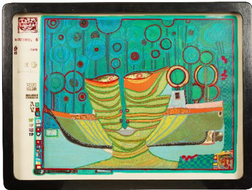
Friedensreich Hundertwasser: Kolumbus Regentag in Indien, 1971 © 2026 Gruener Janura AG, Glarus