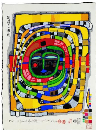
Friedensreich Hundertwasser: Das Recht auf Schöpfung, 1986 © 2026 Gruener Janura AG, Glarus