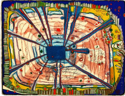
Friedensreich Hundertwasser: 475A Rain of blood is falling into the garden, 1972 © 2026 Gruener Janura AG, Glarus