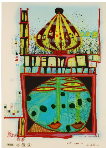
Friedensreich Hundertwasser: 10002 Nights homo humus come va how do you do, 1983 © 2026 Gruener Janura AG, Glarus